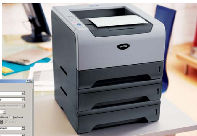
Brother HL-5250DN mit zwei optionalen Papierkassetten LT-5300

Bei Teamdruckern spielt neben der Performance auch das Papier-Management eine wesentliche Rolle. Der HL-5250DN verfügt über eine 250 Blatt Papierkassette sowie eine 50-Blatt-Multifunktionszufuhr. Sollten 300 Blatt Papierkapazität nicht ausreichen? Dann rüsten Sie einfach auf. Bis zu zwei weitere Kassetten für jeweils 250 Blatt werden unterstützt. Bis zu 800 Blatt bieten nicht nur reichlich Vorrat, sondern machen auch flexibel bei der Papierwahl. Die Zuführungen können gezielt angesteuert werden, sodass verschiedene Papiertypen und -größen gleichzeitig benutzt werden können.