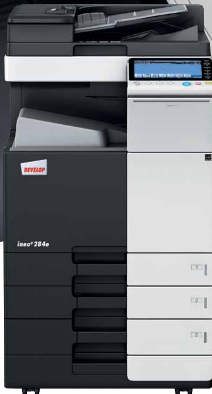
ineo+ 284e mit Papierkassette (PC-210) und Dual Scan Originaleinzug (DF-701)