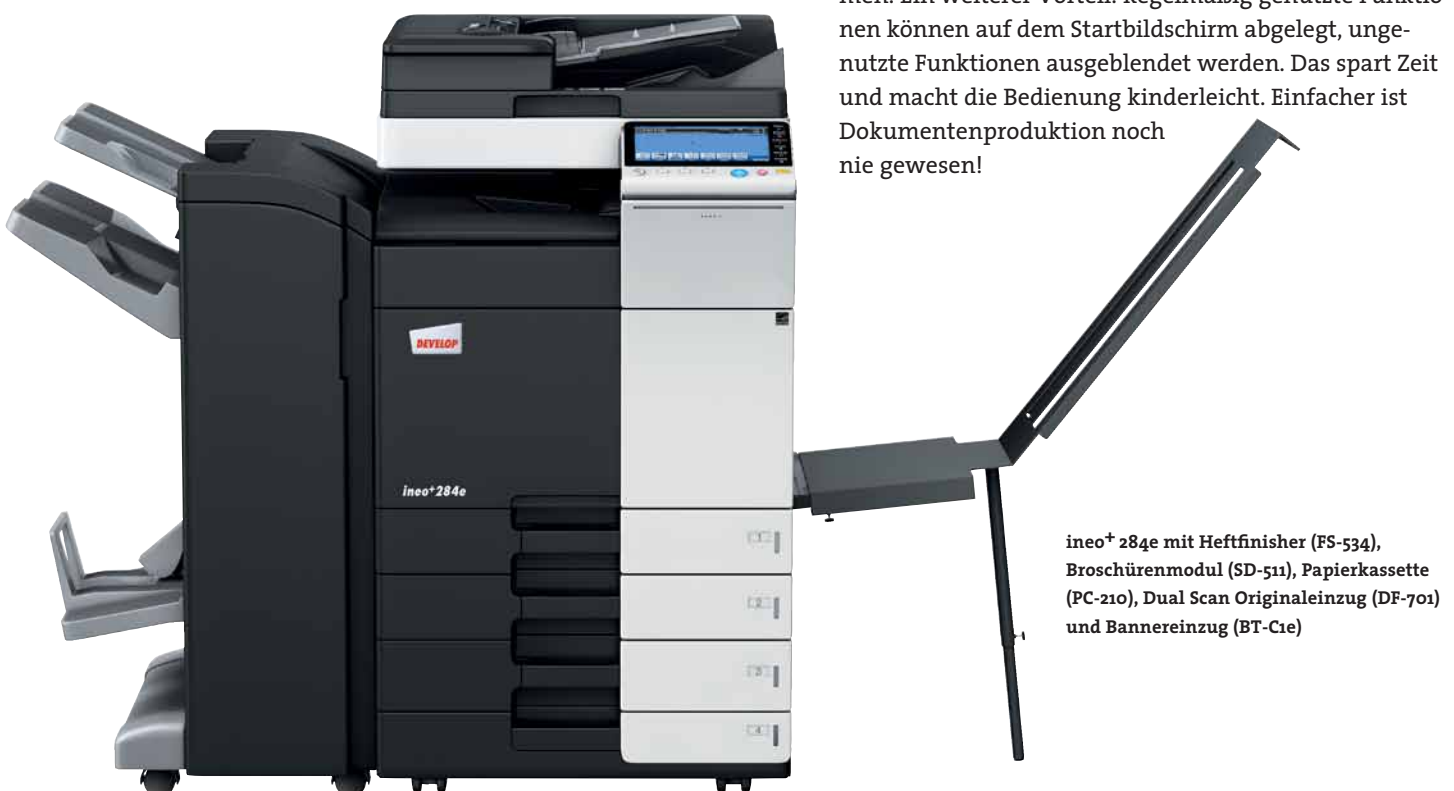
ineo+ 284e mit Heftfinisher (FS-534), Broschürenmodul (SD-511), Papierkassette (PC-210), Dual Scan Originaleinzug (DF-701) und Bannereinzug (BT-C1e)

Viele Multifunktionssysteme sind alles andere als anwenderfreundlich. Doch damit ist nun Schluss – die ineo+ 284e ist für Ihre Anforderungen wie geschaffen. Das Bedienungskonzept ist intuitiv erfassbar und genauso leicht verständlich wie das eines Smartphones oder Tablet-PCs. Der kapazitive 9 Zoll-Touchscreen verfügt über vertraute Funktionen wie flick, drag&drop und pinch in&out, sodass die Bedienbarkeit ganz einfach ist. Und dank der neuen Menüstruktur lassen sich alle Funktionen auf einen Blick erfassen und die gewünschten Einstellungen mit nur wenigen Berührungen vornehmen. Ein weiterer Vorteil: Regelmäßig genutzte Funktionen können auf dem Startbildschirm abgelegt, ungenutzte Funktionen ausgeblendet werden. Das spart Zeit und macht die Bedienung kinderleicht. Einfacher ist Dokumentenproduktion noch nie gewesen!